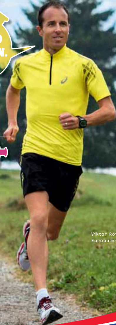
Viktor Röthlin, Europameister Marathon